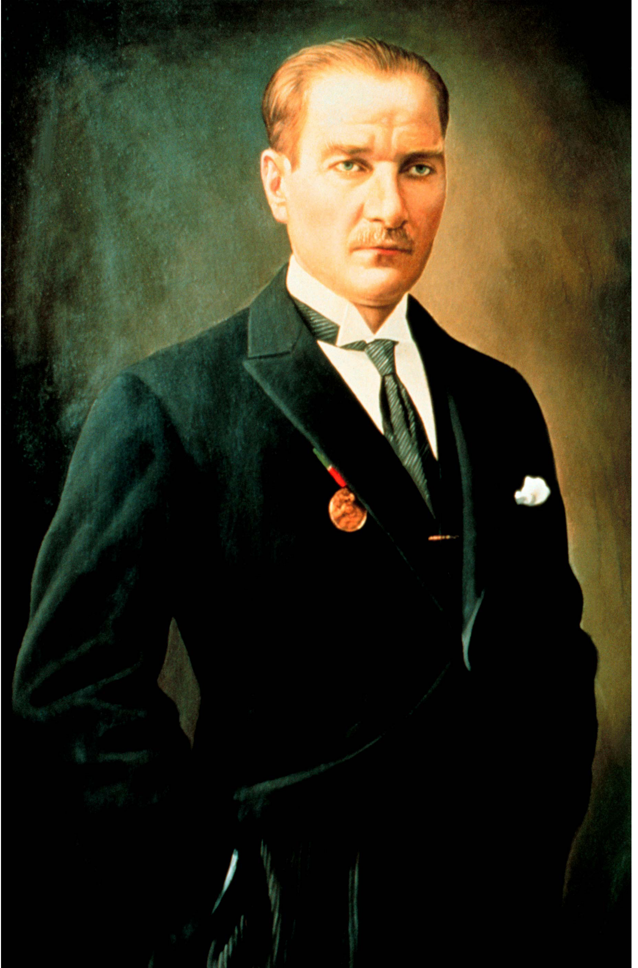
MUSTAFA KEMAL ATATÜRK Türkiye Cumhuriyeti'nin Kurucusu