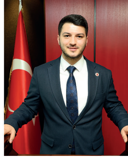
Azim UYSAL AK PARTİ