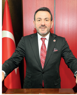
Emrullah BİLGİN AK PARTİ