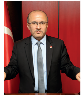
Mustafa ÖNAL AK PARTİ