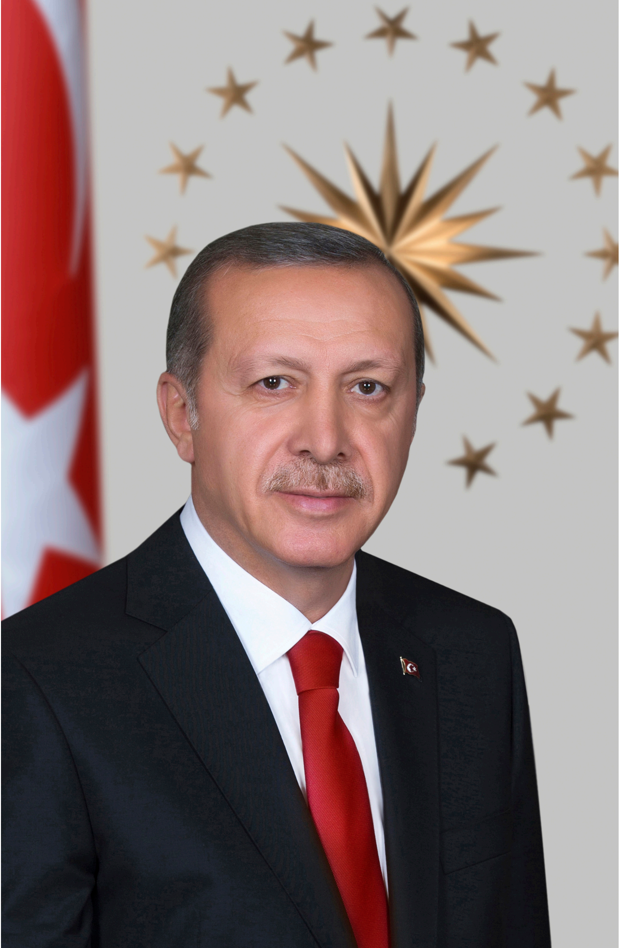
RECEP TAYYİP ERDOĞAN Cumhurbaşkanı